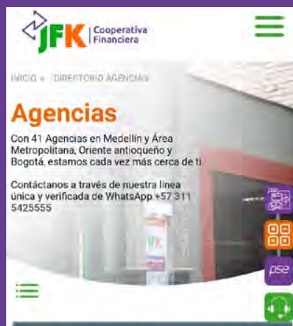
Nuestras 41 agencias