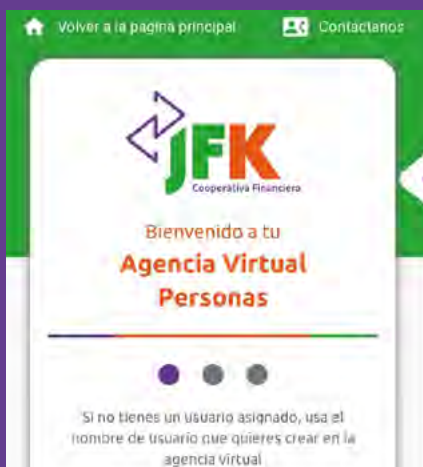
Actualiza tus datos