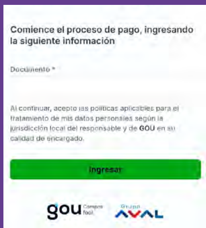
Paga aquí tus productos